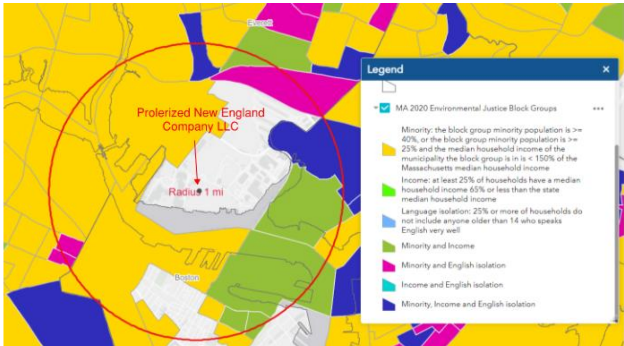
Figura 1: Comunidades de Justiça Ambiental de 2020 dentro de 1 milha

As comunidades de justiça ambiental localizadas dentro de uma milha da instalação incluem: (1) minoria (M); (2) minoria, renda (I) e isolamento do idioma inglês (E); (3) minoria e isolamento do idioma inglês; e (4) minoria e renda. As comunidades de justiça ambiental dentro de uma milha da instalação estão localizadas dentro da cidade de Everett, cidade de Boston, cidade de Somerville, cidade de Medford e a cidade de Chelsea.