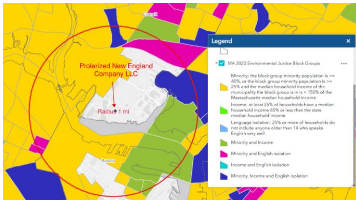
圖1：2020年1英里範圍內的環境正義人群